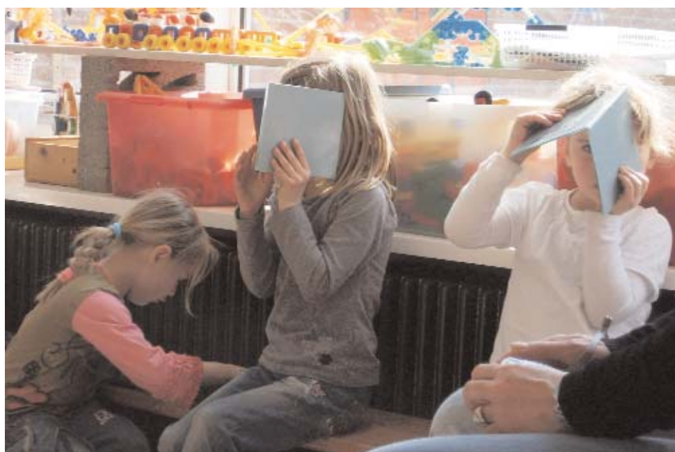
Exploratie van de dubbele spiegel.

Groep 3 en 4: een observatie, een generalisatie, en dan direct het experimentele bewijs! Als dat geen ontdekkend leren is!