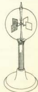
fig. 1 Stralingsmeter of radiometer.

3 We slaan een aantal keren met een hamer hard op een plat stuk lood.