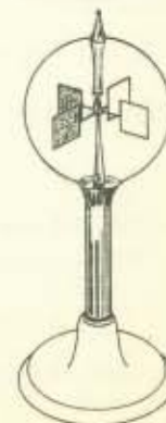
fig. 1 Stralingsmeter of radiometer.

3 We slaan een aantal keren met een hamer hard op een plat stuk lood.